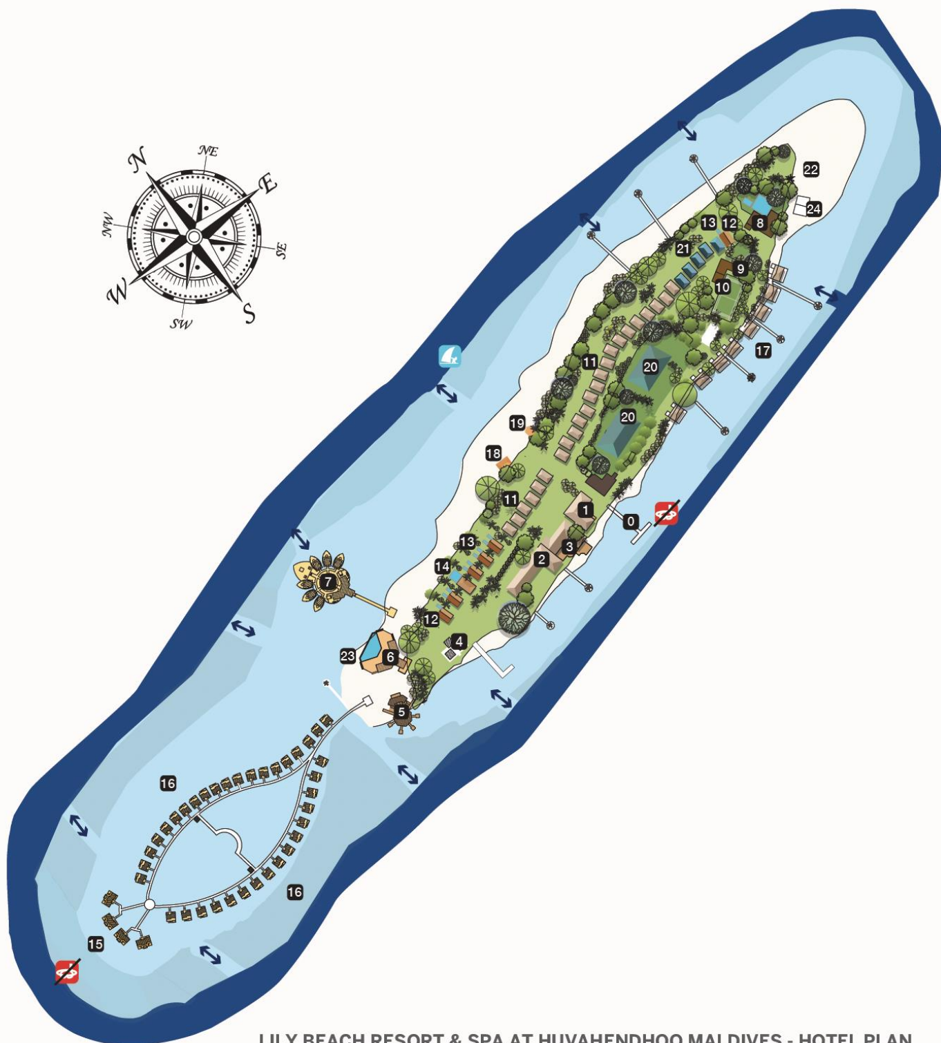
LILY BEACH RESORT & SPA AT HUVAHENDHOO MALDIVES - HOTEL PLAN